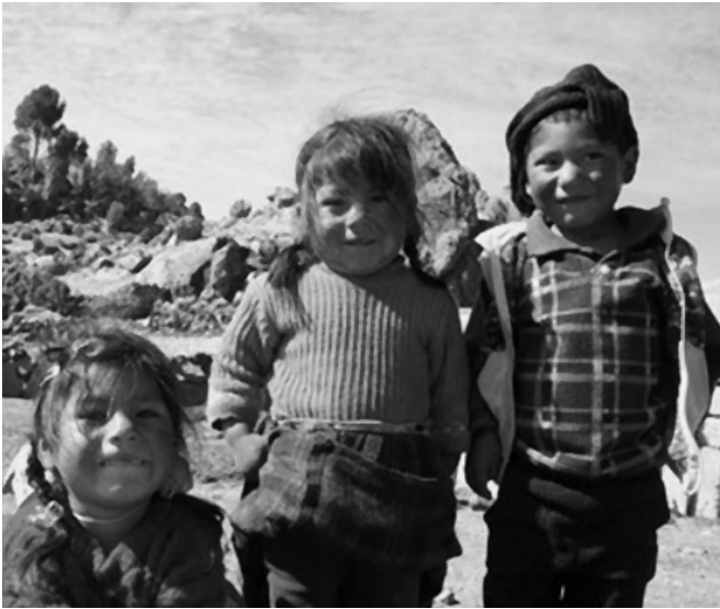
Dentro de las propias zonas rurales, las diferencias son también enormes, si se trata de población de ascendencia indígena o si se diferencia por género, por ejemplo.