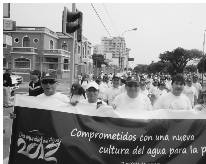
Debe advertirse que los cálculos realizados en el presente estudio subestima el verdadero valor ambiental del daño que las empresas mineras generan en el medio ambiente.

sistema (solo categórico o cualitativo) que sancione si se excede o no un LMP normativo, sino por el daño económico (cualitativo y cuantitativo) que se genera. Un paso intermedio hacia ese sistema de sanciones, es avanzar con propuestas para la implementación de un sistema de multas y sanciones basadas en criterios económicos para el resto de recursos naturales afectados por las actividades mineras-metalúrgicas, como el aire y el suelo, por ejemplo. Esta tarea, así como el estudio de metodologías para analizar la contaminación que generan las empresas de la minería informal (no estudiada en la presente investigación) constituyen líneas para futuras investigaciones.