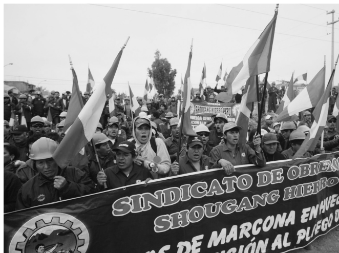
En este estudio se estimó, para los años 2008 y 2009, a cuánto ascendería el costo económico de la contaminación minera en el agua.