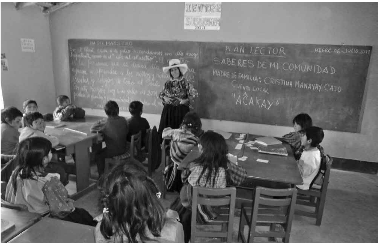
Cada vez son más. A pesar de que menos de la mitad de nuestros niños y niñas logran un buen desempeño académico en la escuela, este porcentaje se ha venido agrandando en los últimos años.

el estado nutricional de los niños y niñas en su infancia temprana como función de los precios; y en la segunda, modela el rendimiento como función del estado nutricional predicho en la primera etapa.