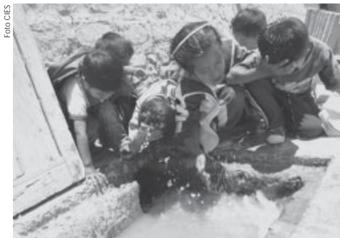
Agua potable. Solo 64% de los hogares accede a la red pública.

«...uno de cada cuatro niños peruanos menores de cinco años sufre de desnutrición crónica. [...] el 69% de los niños menores a dos años son anémicos...»