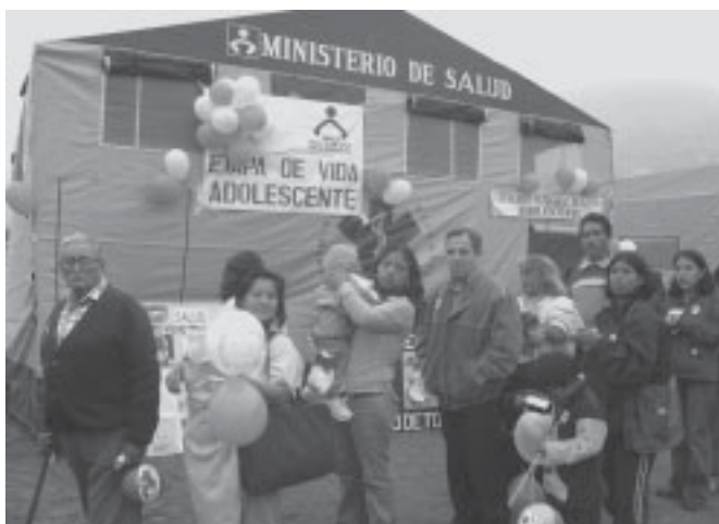
Segmentación del sistema de salud. Genera ineficiencias.