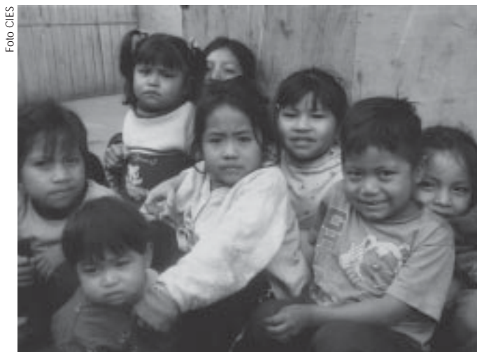
Demanda educativa en salud. Es superior a la oferta de las universidades e institutos.

Finalmente, el quinto cambio es el serio debilitamiento de la rectoría en el campo de los recursos humanos, con la dispersión de los ámbitos de rectoría formal y real, tanto dentro como fuera del sector salud,